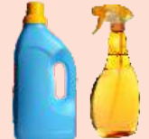
Cleaning Solutions Líquidos de limpieza