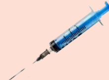
Sharps and Medications Jeringas y medicamentos