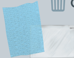
Film plastic & bubble-wrap Las envolturas de plástico y de burbujas