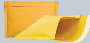
Padded & bubble-lined paper envelopes Sobres de papel acolchados y forrados con burbujas