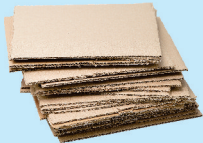
Cardboard Remove all contents and flatten Cartón Quitar todo el contenido y aplanar