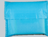
Bubble-lined plastic envelope Burbujas sobre de plástico