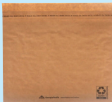
Paper envelopes Sobres de papel