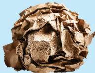
Packing paper Papel de Embalaje