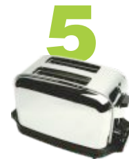
5 Tostadores de pan son reciclables.