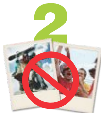
2 Polaroids NO son reciclables.