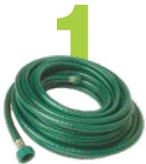
1 Las mangueras son reciclables.

¿Alguna vez tiene problemas para determinar si un artículo es reciclable o no? Aquí hay 6 artículos confusos que han dejado confundidos a muchos, y con frecuencia se encuentran en el contenedor equivocado. Ayúdenos a manejar sus materiales de manera eficiente mediante la colocación de estos artículos en el contenedor correcto.