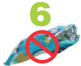
6 Bolsas de papitas NO son reciclables.