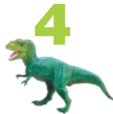
4 Juguetes de plástico son reciclables.