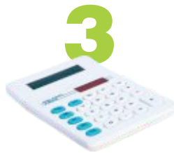
3 Calculadoras son reciclables.